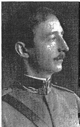
◆ Le roi Zog I er

en juin 1924, son gouvernement est tombé à la suite d'un coup d'État. En décembre de la même année, les organisations qui se trouvaient rejetées dans l'opposition et contraintes à l'exil ont repris le pouvoir et ont appelé leur coalition « Mouvement de la Légalité », afin de signifier qu'ils représentaient le mouvement