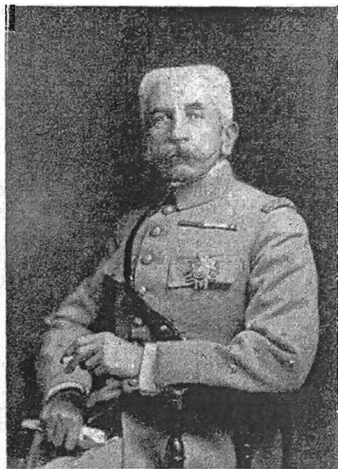
◆ " Le maréchal en grand uniforme, mais qui tient à la main une cigarette... "

La reconstruction du pays se fait également par un impressionnant programme qui porte sur l'urbanisme, les infrastructures, l'école, le système de santé et de nouvelles institutions judiciaires qui prennent en compte les traditions du pays. Lyautey entend