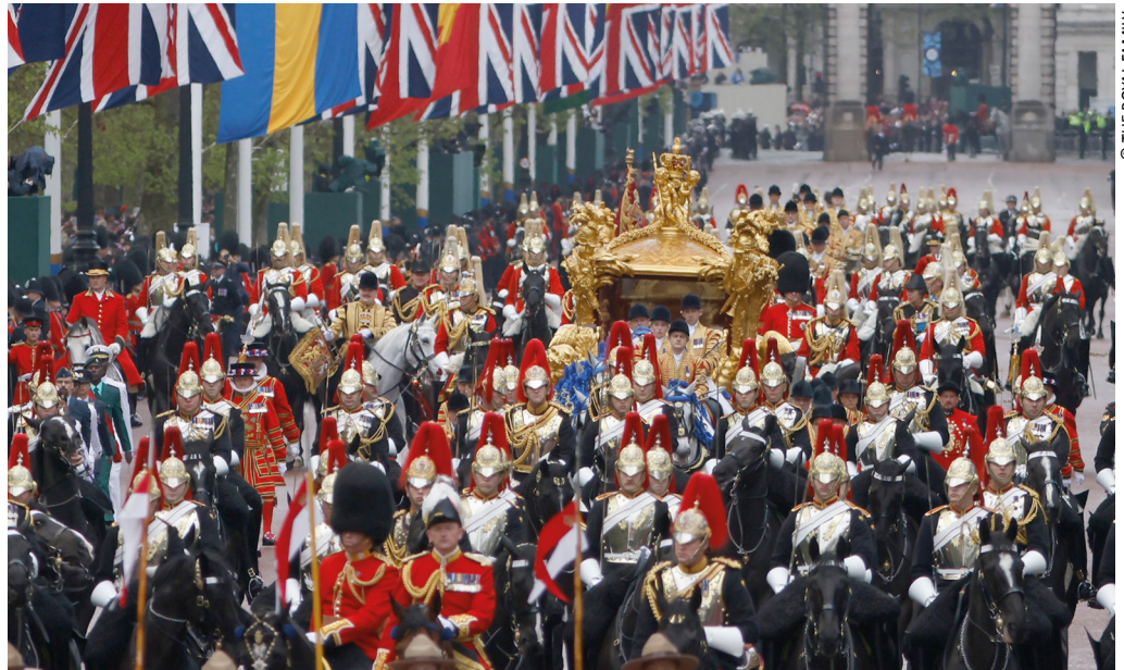
Le couronnement du roi Charles III. Une journée mêlant tradition, unité nationale et liesse populaire.

niser, ouvrir et raccourcir la cérémonie, qui n'a duré qu'à peine plus de deux heures et a été limitée à 2 000 invités, mais qui a compris pour la première fois toutes les composantes de la société : anglaise, de souche ou non, aristocratique ou non (les pairs héréditaires du royaume n'ont pas tous été invités), de toutes catégories sociales, en faisant honneur aux communautés, organisations caritatives et personnes méritantes, dont les jeunes aidés par le Prince's Trust quand Charles était prince de Galles. Cette célébration se voulait également, pour la première fois, œcuménique, en présence de tous les chefs religieux de toutes les confessions que