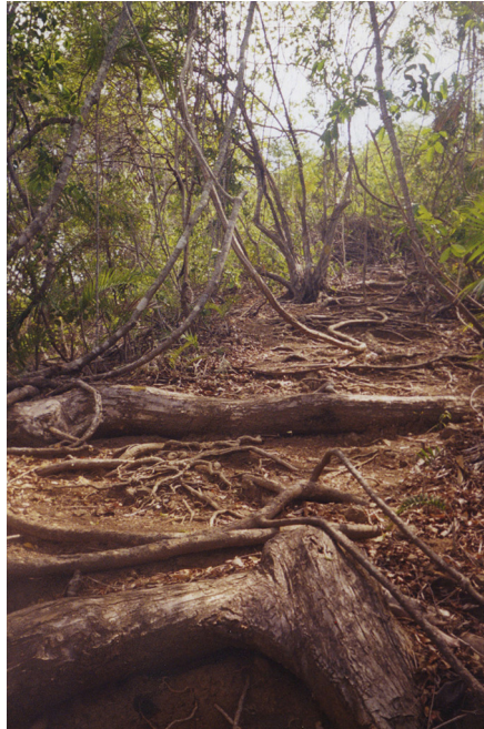
La forêt équatoriale, au sud-est du Costa Rica.

La situation actuelle n'est pas merveilleuse. Les cinq voisins, Nicaragua, Salvador, Honduras et Guatemala au nord, Panama au sud, sont en proie à l'insécurité, à la corruption, au trafic de drogue, à des formes de gouvernement de plus en plus autoritaires, qui gagnent le paisible Costa Rica, champion de l'indice du bonheur humain, « Suisse de l'Amérique centrale », qui, selon la conférence épiscopale catholique nationale à Pâques, traverse l'un des « moments les plus difficiles de son histoire ». Le président actuel, Rodrigo Chaves Robles, à Paris le 24 mars, a alerté sur l'afflux de réfugiés (100 000 en provenance du Nicaragua, en proie à une répression sévère par le couple présidentiel Ortega, ex-révolutionnaire sandiniste) et des gangs chassés du Salvador (par la main de fer du jeune président Nayib Bukele).