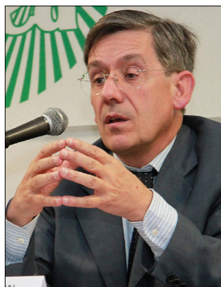
Charles de Courson. L'homme qui sème la panique au sein de la macronie.

Favorables à la décentralisation, ces députés se déclarent « attachés au progrès, à la justice et à la cohésion sociale » et s'opposent à la réforme des retraites. Après les brutalités procédurales qui ont attisé la colère d'innombrables citoyens, il était logique que le groupe LIOT dépose sur le Bureau de l'Assemblée une proposition de loi visant dans son premier article à abroger le recul de l'âge légal de départ à 64 ans et l'accélération de l'augmentation de la durée de cotisation. L'article 2 propose l'organisation avant la fin de l'année d'une conférence sur le financement du système de retraite, et l'article 3 prévoit que la charge pour l'État et pour les organismes de sécurité sociale soit compensée