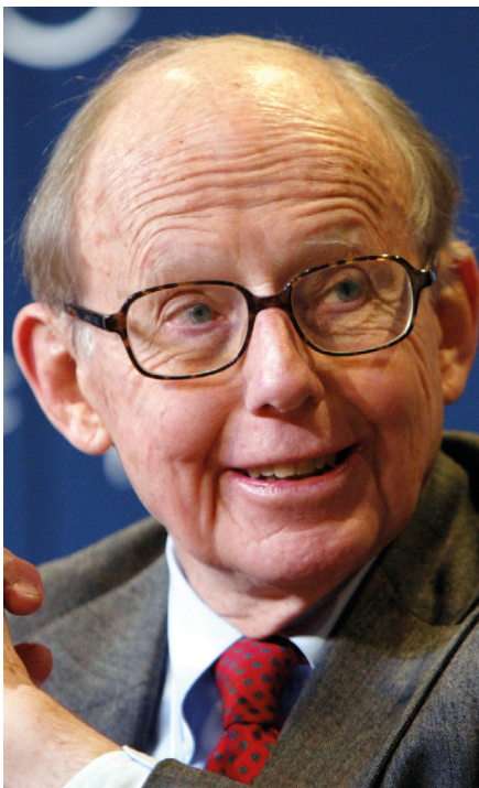
Samuel Huntington. Son « choc des civilisations » a fait long feu.

La Chine se reconnaît en tant que nation depuis 1911. En tant que civilisation, elle revendique entre deux et cinq millénaires. Introduire le terme de civilisation fait référence à des régimes d'historicité totalement différents. S'il est utile de les connaître, comme l'ancien président Chirac y excellait, il est vain de s'y fonder pour évaluer les enjeux contemporains ou à venir. Xi Jinping définissait la civilisation comme l'âme de la nation. Il