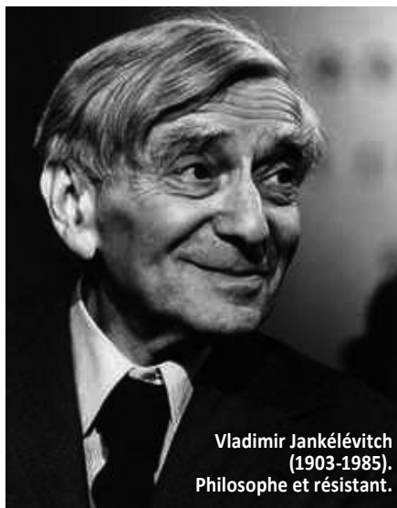
Vladimir Jankélévitch (1903-1985). Philosophe et résistant.