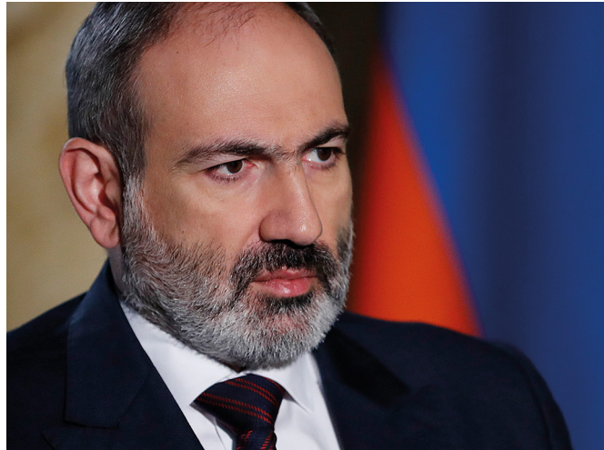
Le Premier ministre arménien Nikol Pashinyan. La relation avec Moscou n'est plus au beau fixe.

Les autorités azéries n'ont depuis lors eu de cesse de préparer la revanche. L'Arménie n'a trouvé son salut qu'à travers un rapprochement avec la Russie et dans une moindre mesure avec l'Iran. Pour la Russie, c'est un moyen de garder un pied dans le Caucase et pour l'Iran d'endiguer toute