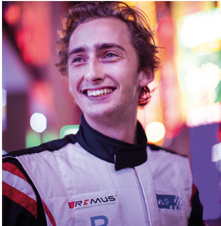
Le prince Ferdinand de Habsbourg.

■ 18 avril. Rome. – Parution de The Habsburg Way , par Édouard de Habsbourg, ambassadeur de Hongrie auprès du Saint-Siège depuis 2015. Préfacé par le Premier ministre hongrois, Viktor Orbán, il énumère sept règles déduites de l'histoire de la famille : se marier et avoir beaucoup d'enfants ; être catholique pratiquant ; croire dans l'Empire et la subsidiarité ; défendre l'ordre et la justice ; savoir qui l'on est et se comporter en conséquence ; montrer son courage dans la bataille ou avoir un bon général ; bien mourir et avoir des funérailles grandioses. L'archiduc, fils du dernier prince palatin de Hongrie, contribua à la visite du pape François à Budapest du 28 au 30 avril. Le New York Times lui a consacré un portrait, le 27 avril.