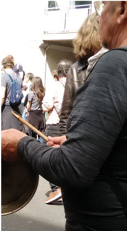
Concert de casseroles contre la présence de Macron à Lyon, le 8 mai 2023.

Emmanuel Macron peut-il réparer en cent jours les dégâts de trois mois de mobilisation contre sa réforme des retraites ? Il n'en prend pas le chemin. L'envoi au tribunal de manifestants n'est pas de nature à calmer les opposants à la réforme des retraites. Ses voyages en province, à force d'ériger cordons policiers et déroulements feutrés pour initiés, vont vite être perçus comme une tournée de villages Potemkine. Les termes, le ton employé à l'égard des manifestants comme les postures sont de moins en moins tolérés et de plus en plus perçus comme des bravades ou des provocations. Le public présent n'est pas celui des Gilets jaunes ; il est plus large et agglomère cadres et vraisemblablement des électeurs autrefois convaincus par le discours macronien. Certains sont excédés par une façon de gouverner autant que par le projet de réforme des retraites. D'autres se saisissent du mouvement pour protester contre la dégradation de leurs conditions de vie.