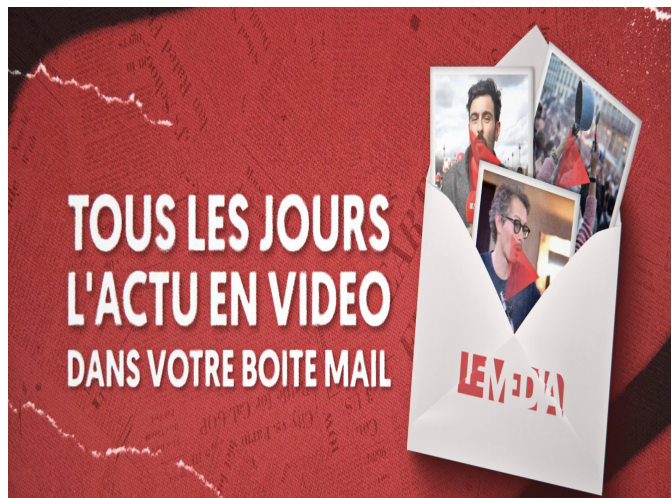
Image de couverture du site Le Média TV. Pour de nombreux jeunes, une alternative à l'information officielle.

Ce qui oppose ces nouveaux médias à la TV réside dans leur spécialisation – à l'exception de quelques rares cas. On peut donc suivre un Youtuber ne parlant spécifiquement que de stratégie militaire et de l'histoire qui lui est associée, le tout dans des formats de longueur variable. La durée n'est plus une limite puisque les plateformes d'hébergement permettent un stockage quasi