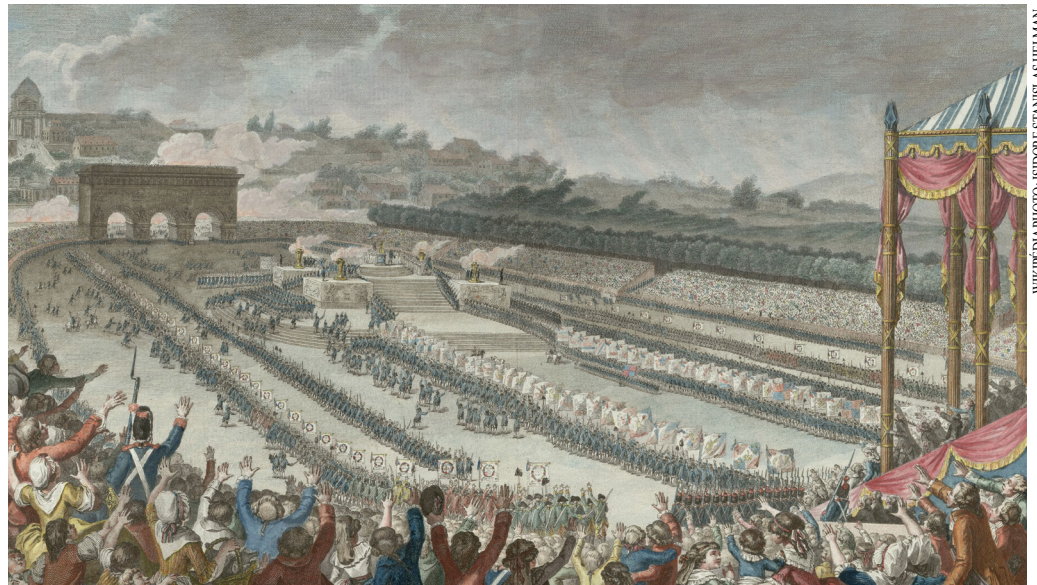
La Fête de la Fédération, le 14 juillet 1790. Une monarchie parlementaire était possible.

L'exposition de l'hôtel de Soubise se concentre sur la situation dans laquelle se trouvait alors la famille royale au château des Tuileries, du 6 octobre 1789 au 10 août 1792. Elle comprend quatre chapitres : la vie quotidienne de la Cour aux Tuileries, le difficile partage du pouvoir politique entre le roi et l'Assemblée, la rue et la pression de l'opinion publique, l'influence de la sphère internationale. Les riches collections des Archives nationales permettent de brosser un tableau des trois dernières années du règne de Louis XVI. Parmi les objets, gravures, œuvres d'art et pièces du mobilier des Tuileries, les visiteurs découvriront la Constitution de 1791, la Déclaration des droits de l'homme et du citoyen, le journal de Louis XVI ouvert aux pages des années 1791-1792, son manifeste politique aux Français (20 juin 1791), un portrait de la reine rarement exposé et la correspondance entre Marie-Antoinette et le comte de Fersen. Les Archives donnent la parole aux gouvernants comme au peuple de la rue qui s'exprime par des pétitions, journaux, pamphlets ou des billets placardés dans les rues.