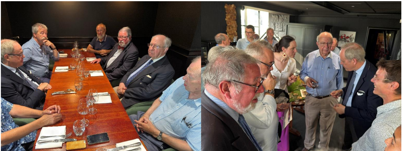
Déjeuner de travail et pot amical avec les royalistes de l'Ouest.