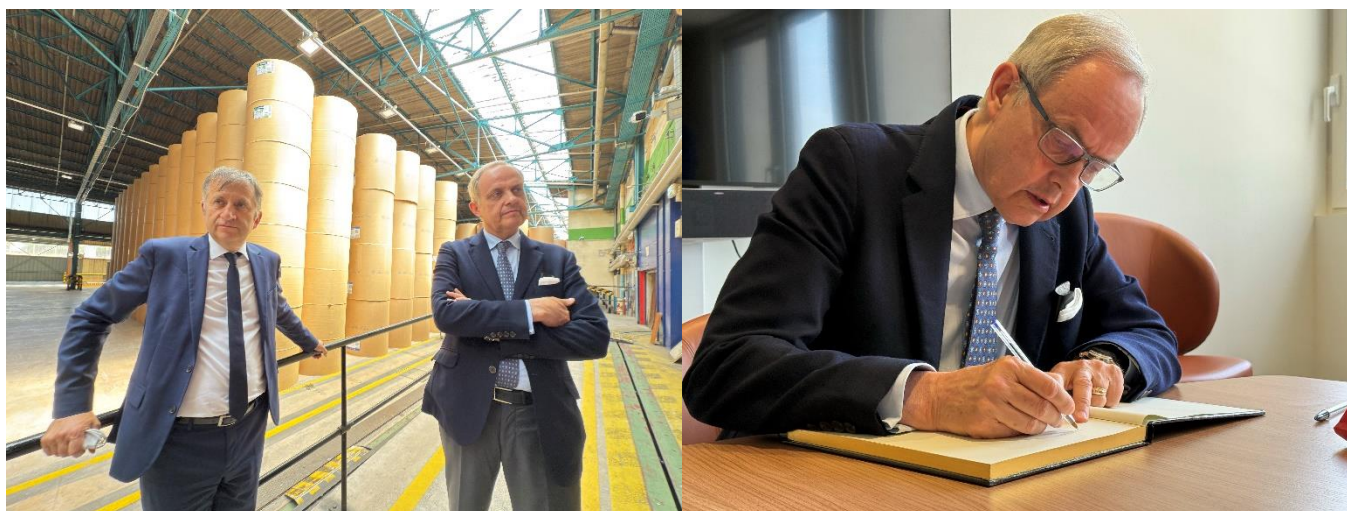
La visite de l'imprimerie d'Ouest-France et la signature du livre d'or.