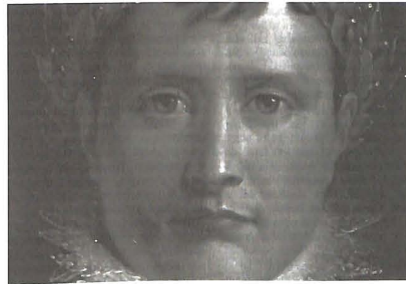
◆ L'Empire revient-il ?

Lorsque le philosophe se fait expert en relations internationales, le diplomate à son tour doit-il philosopher ? Sans quitter Maastricht, prenons de la hauteur.