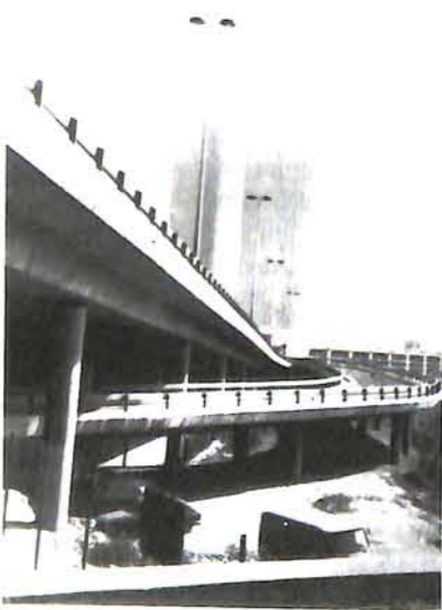
◆ Investir largement dans les Travaux publics.

Ces secteurs d'activité créent des emplois. Créer des emplois normaux soulage les divers organismes sociaux par les allocations à ne plus payer et les cotisations sociales nouvelles encaissées, stimule la