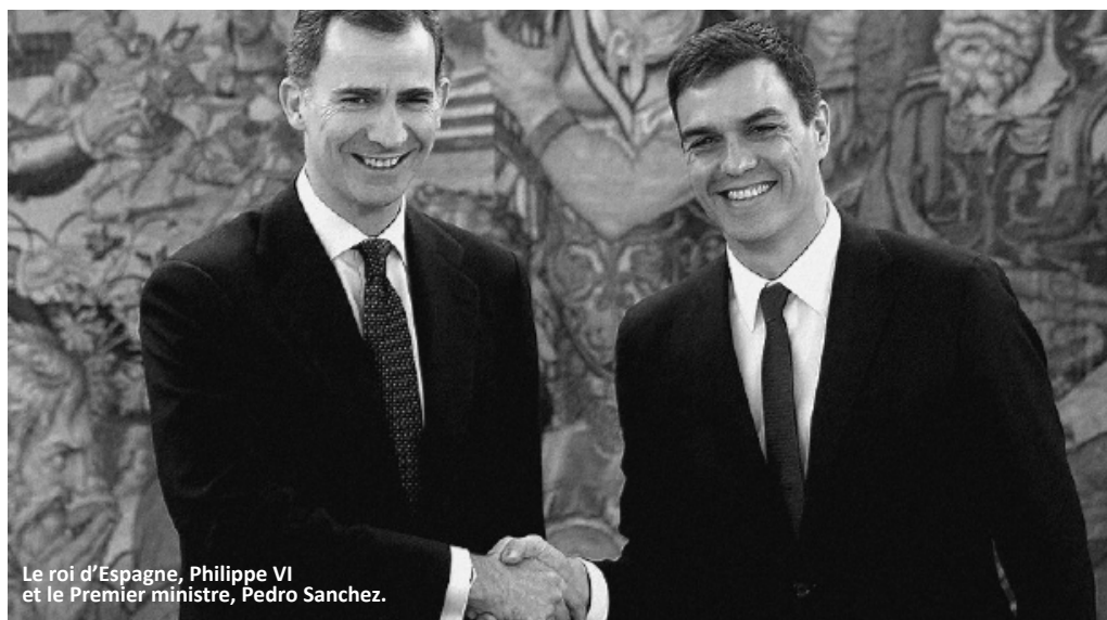
Le roi d'Espagne, Philippe VI et le Premier ministre, Pedro Sanchez.

Cette maquette renouvelée marque une étape. Notre équipe de rédaction s'est élargie, le nombre de nos abonnés progresse, le soutien de nos souscripteurs aussi. Nous mettrons en place au premier trimestre 2020 un site internet flamboyant neuf pour le journal. N'hésitez pas à nous écrire pour faire part de vos suggestions. Et maintenant, en route ! ■