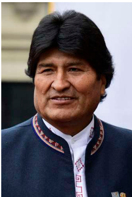
Evo Morales, ex-Président de la Bolivie renversé récemment par un coup d'État.