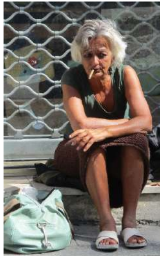
Le taux de pauvreté a augmenté de 7,3 % entre 2006 et 2016.

Ne serait-ce pas plutôt la nature de ces travaux qui poserait problème au gouvernement ? s'interrogent des économistes et sociologues dans une tribune