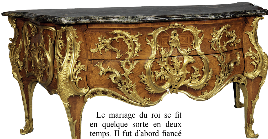
Commode de la chambre de Louis XV à Versailles, par Gaudreau et Caffieri, 1739 (Londres, Wallace Collection). Les portes des vantaux latéraux dissimulent deux petits placards servant à ranger le matériel du barbier du roi.

connu qu'il a suivi, à onze ans, des cours de haut niveau au collège d'Harcourt. Adulte, il fit créer au château de La Muette un pavillon d'optique et de physique.