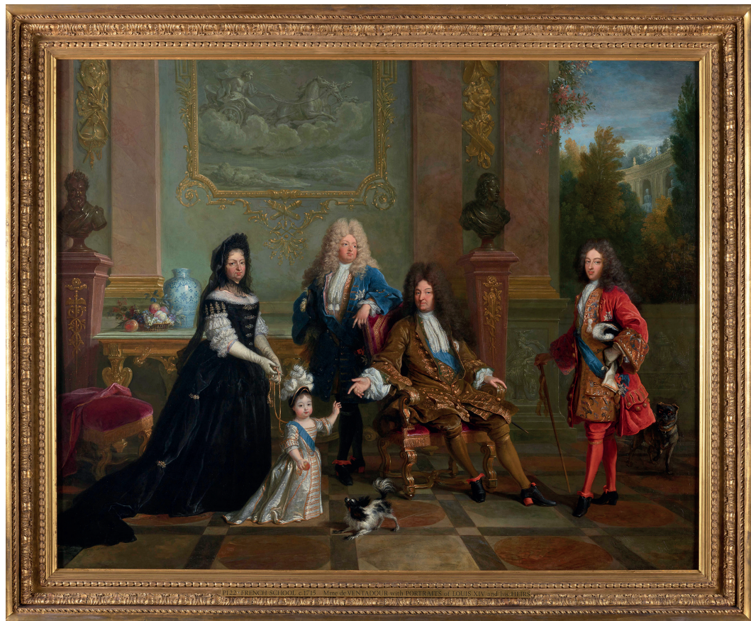
Madame de Ventadour avec le roi Louis XIV et ses héritiers, par Nicolas de Largillière (Londres, Wallace Collection).

Contrairement à la volonté de Louis XIV qui n'avait pas confiance en son neveu et ne l'aimait pas, le duc d'Orléans fait casser le testament du roi par le Parlement et devient régent alors que le roi s'y opposait. Contre les volontés de Louis XIV également, une de ses premières mesures est de ramener le petit roi et la cour à Paris ; ils s'installent au palais des Tuileries pendant sept ans, tandis que le Régent gouverne depuis son Palais-Royal. Finalement, toute la cour reviendra à Versailles en 1722 ; le petit roi a alors 12 ans, et il est