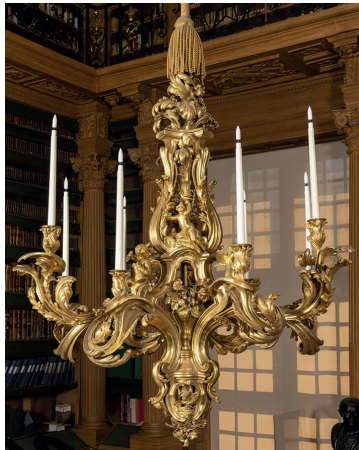
Lustre en bronze de la bibliothèque Mazarine, ciselé par Caffieri.