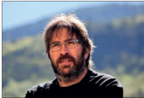
par Jean-Paul Pelras *