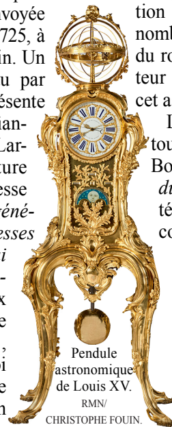
Pendule astronomique de Louis XV.

Le visiteur est accueilli dès le vestibule par l'incroyable pendule astronomique réalisée par Claude-Siméon Passemant, « icône » de Versailles. L'horloger mit vingt ans à la concevoir, puis l'ingénieur mécanique mit dix ans à la réaliser, et les frères Caffieri, bronziers, travaillèrent pendant quatre ans sur le cabinet en bronze... Sa sphère mouvante montre le système solaire avec les sept planètes connues tournant autour du soleil, et la rotation de la lune autour de la terre. Elle donne les équinoxes, les deux solstices et les éclipses de soleil et de lune, ainsi que les signes du zodiaque. La cadran affiche l'heure, la minute et la seconde. Le balancier bat la seconde. Le disque tournant fait ap-