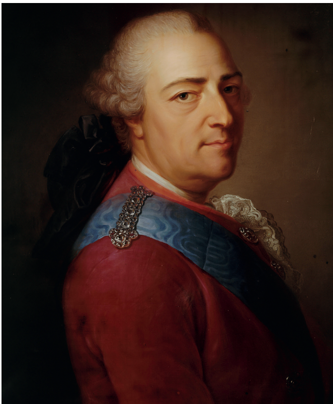
Portrait de Louis XV à 64 ans, l'année de sa mort, 1774, par Armand Vincent de Montpetit (château de Versailles).

Arrière-petit-fils de Louis XIV, Louis devient roi à 5 ans en 1715, après la mort, en moins de deux ans, de son grand-père le « Grand Dauphin », de son père le duc de Bourgogne puis « Petit Dauphin », et de ses frères aînés les deux petits ducs de Bretagne, décédés respectivement à un an et 5 ans. Tous les quatre prénommés Louis. Autant dire qu'il n'aurait pas dû être roi. En 1710, le Roi-Soleil était fier d'avoir la descendance la plus fournie et la mieux assurée de tous les souverains contemporains : cinq héritiers mâles ! En 1712, le monarque malade, âgé de 74 ans, se retrouve avec pour seul héritier un frêle enfant de deux ans, à la santé délicate. Trois générations balayées en moins de deux ans ! Beaucoup de témoins de l'époque affirmèrent que ce fut sa gouvernante, Madame de Ventadour, « Maman Ventadour », qui lui sauva la vie en l'éloignant des médecins et de leurs redoutables saignées, en se barricadant avec le petit duc d'Anjou dans un appartement fermé à clef, en le soignant elle-même et en goûtant avant lui tous ses aliments. Les plus lucides des courtisans, ou les plus mauvaises langues, ou les plus complottistes, nous ne le saurons jamais, accusent le duc d'Orléans, neveu du roi, d'avoir empoisonné au moins l'un ou l'autre des héritiers, ce qui le rapprochait à chaque fois du trône. Le