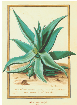
Aloès africana, gouache sur vélin par Claire Aubriet (Paris, Muséum national d'histoire naturelle).