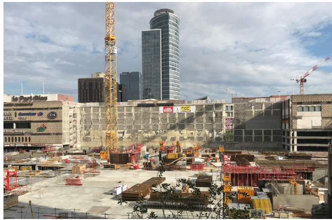
Aménagement du quartier de La Part-Dieu à Lyon en 2018. L'urbanisme a toujours attiré les grands groupes financiers.

Mais depuis une trentaine d'années, ce marché est sous la coupe des gestionnaires d'actifs. Ces mastodontes financiers (fonds de pension ou d'investissements le plus souvent anglo-saxons) investissent dans les grandes métropoles, avec le soutien des autorités locales, dans le cadre de grandes opérations de rénovation urbaine, plus ou moins justifiées dans leur principe mais critiquables par leur caractère fortement spéculatif. Celles-ci sont de moins en moins bien acceptées par les populations des quartiers concernés car elles créent une financiarisation directement responsable d'une mono-