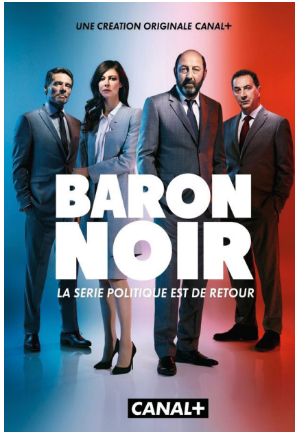
Affiche de la série Baron noir . Plus vraie que nature !

La quête de « récit », placebo du politique. – Là où le problème affleure, c'est certainement lorsque les acteurs politiques, en panne d'inspiration, cherchent dans la fiction télévisuelle et les séries une sorte de canevas à leur propre action. Il est vrai