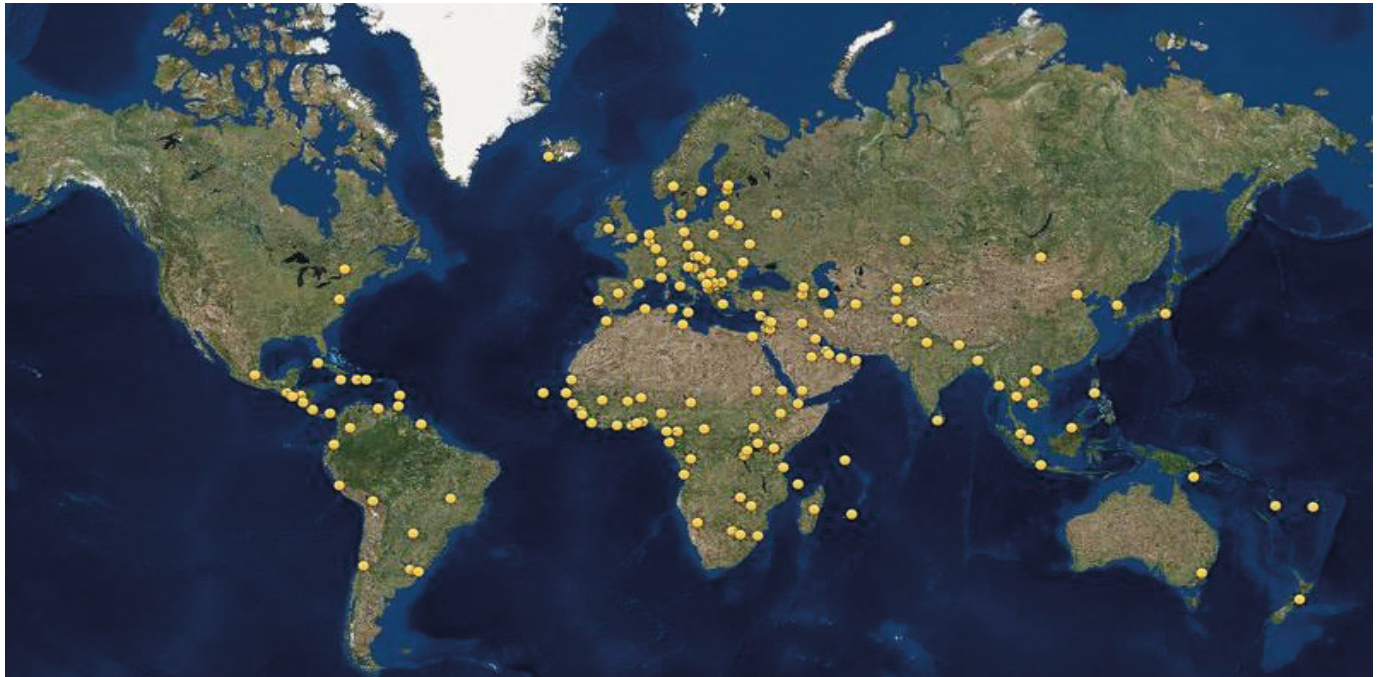
Carte des ambassades de France dans le monde. Quel usage la France fera-t-elle de ce précieux réseau en 2024 ?