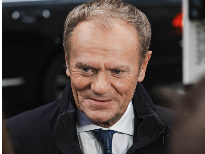
Le Premier ministre Donald Tusk. Sa cohabitation avec le président nationaliste, Andrej Duda, sera difficile.

Le 12 décembre 2023, Donald Tusk qui avait dirigé le gouvernement polonais de 2007 à 2014 et présidé le Conseil des chefs d'État ou de gouvernement de l'Union européenne de 2014 à 2019, a été investi président du Conseil par la Diète polonaise et, le lendemain, a vu son gouvernement obtenir le soutien de cette assemblée. Ce retour est le fruit de la défaite de la coalition gouvernementale conservatrice au pouvoir lors des élections législatives et sénatoriales du 15 octobre 2023. Certes, le PiS a obtenu le plus important score en termes de voix et de sièges (35,38 % des voix et 194 sièges) mais, même avec l'apport des 18 députés de la coalition d'extrême droite dirigée par Krzysztof Bosak, il restait loin des 231 sièges nécessaires pour obtenir la majorité. Au contraire, l'union de la Coalition civique (KO) menée par Donald Tusk (30,70 % des voix et 157 députés), de la Troisième voie de Władysław Kosiniak-Kamysz et Szymon Hołownia (14,40 % des voix et 65 élus) et de