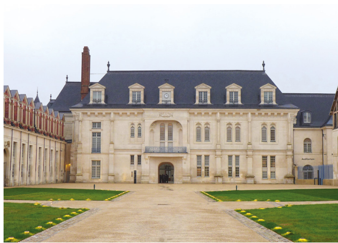
Château de Villers-Cotterêts. La cour des offices, après restauration.

Lors de la Révolution, le château est transformé en caserne. En 1804, Bonaparte en fait un dépôt de mendicité. Il reste ensuite en chantier perpétuel. Selon les besoins, les espaces sont agrandis ou réduits, entraînant la destruction et la construction