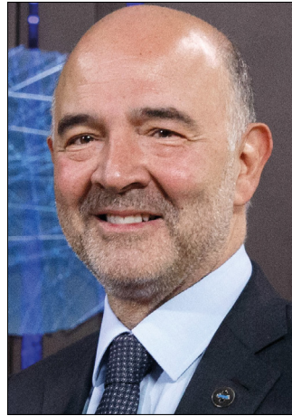
Pierre Moscovici. Il « assume complètement » le report de la publication du rapport sur l'immigration.

Ce rapport fait état d'« une efficacité incertaine » de la politique de lutte contre l'immigration irrégulière : alors qu'en 2022, 134 280 obligations de quitter le territoire français (OQTF) ont été prononcées, seulement 11 406 personnes ont été expulsées (dont 7 214 « éloignements forcés ») : « Ce découplage entre le nombre de mesures d'éloignement prononcées et leur exécution effec-