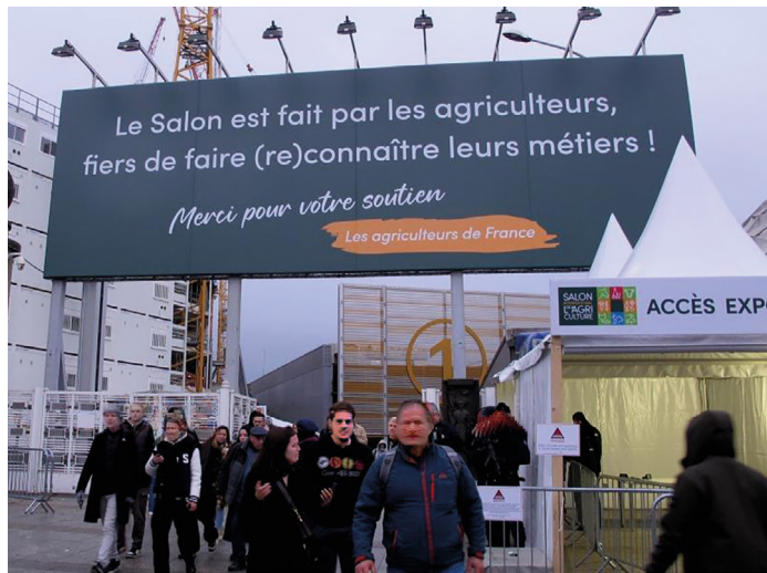
Le Salon de l'agriculture 2024. Haut-lieu des revendications paysannes.

ceux de la FNSEA (et de sa filiale que constituent les Jeunes agriculteurs), souvent tentés de se présenter sous diverses étiquettes, RPR hier, LR et Renaissance aujourd'hui.