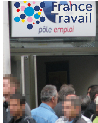
La chasse aux chômeurs, sport préféré du pouvoir.

En 2018, à l'occasion de contrôles aléatoires, Pôle em-