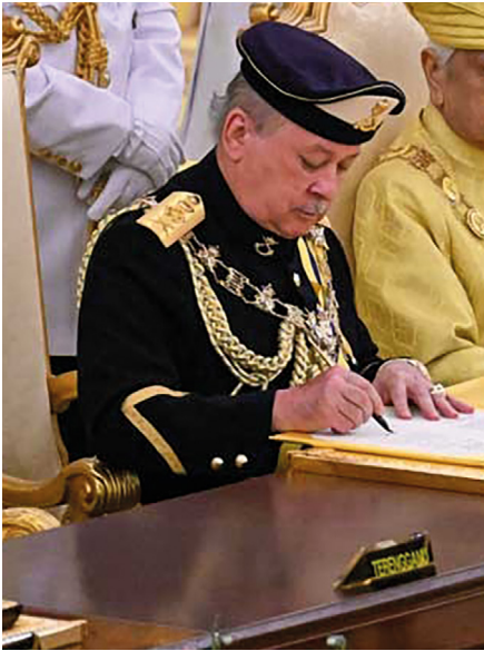
Le sultan Ibrahim Iskandar de Johor, 17 e roi de Malaisie.

26 février. Kuala Lumpur. – Ouverture de la session parlementaire par le nouveau roi de Malaisie (ou Yang di-Pertuan Agong), qui avait pris ses fonctions, le 31 janvier, pour cinq ans. Sultan de l'État le plus méridional de la péninsule, Johor, frontalier de l'État souverain de Singapour, Ibrahim Ismail Iskandar, 65 ans, a fermement averti les députés et les partis qu'il ne souhaitait pas revivre les difficultés qu'il avait connues son prédécesseur qui eut à gérer une situation politique chaotique, d'une douzaine de partis, sans majorité claire, qui avait vu se succéder trois Premiers ministres en quatre ans. Alors que les élections du 19 novembre 2022 avaient abouti à un parlement sans majorité, le roi avait manœuvré pour réussir à imposer l'actuel Premier ministre Anwar Ibrahim, dans l'opposition pendant plusieurs décennies. Le roi actuel a mis en garde contre toute tentative politique pour affaiblir le gouvernement. Ce rôle de la monarchie (tournante) dans la phase de transition politique que vit le pays risque ainsi de peser sur la dimension cérémonielle de la monarchie constitutionnelle. Simplement parce que pendant trois décennies de grande stabilité, aucun problème de cette nature ne s'était posé.