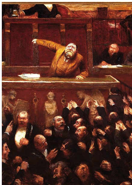
Intervention houleuse de Jaurès à la Chambre en 1907 (Jean Veber, musée Carnavalet).

Ces prudences de méthode, qui caractérisent la démarche d'intention scientifique, n'empêchent pas les chercheurs de mettre en évidence des réalités de divers ordres. Jérôme Fourquet croise les facteurs géographiques (villes, routes, paysages...) et les caractéristiques socioculturelles (le niveau de diplôme...) pour souligner la « métamorphose » de la société française. Culturellement structurée par le catholicisme et le communisme et organisée sur le mode bipartisan, la France est aujourd'hui travaillée par des logiques de dislocation et confrontée à une tripartition politicienne (droite populiste, centre macronien, fractions de gauche). Julia Cagé et Thomas Piketty étudient avec une grande précision l'histoire électorale, les déterminations géographiques et les facteurs sociaux, en insistant sur les rapports de classe. Pour eux, « la classe sociale n'a jamais été aussi importante qu'aujourd'hui pour comprendre les comportements de vote ». C'est là un constat que l'on peut partager dans une large mesure, mais Julia Cagé et Thomas Piketty sortent de leur réserve méthodologique pour souhaiter une nouvelle bipolarisation droite-gauche, qui opposerait un bloc social-écologique à un bloc libéral-national. Je renvoie à un