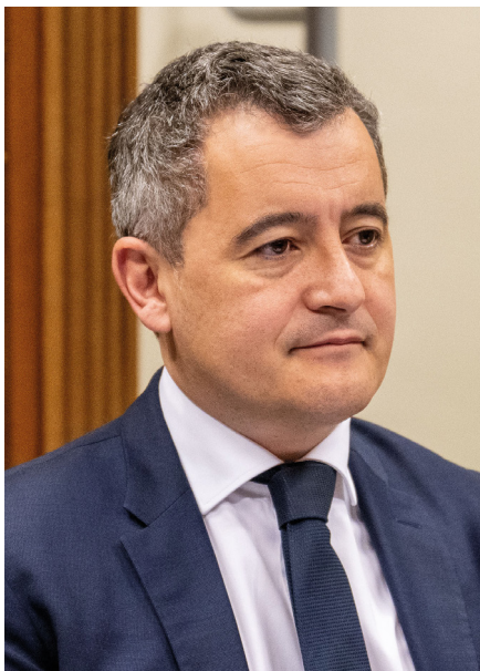
Gérald Darmanin. Son projet de loi sur Mayotte n'apportera pas de vraies solutions.

Une décision dangereuse. – « Notre droit de la nationalité est le fruit d'une longue histoire et d'un savant équilibre » (2). Il faut considérer deux points ici. Le premier, c'est que Mayotte est un département français : sur des sujets aussi graves que le droit à la nationalité, il ne peut y avoir de différence constitutionnelle entre l'île et la France tout entière. Beau cadeau à l'extrême droite, qui, n'étant pas à une infamie près, réclame depuis longtemps cette suppression générale du droit du sol pour tout le pays. Le deuxième, c'est que la France s'est équilibrée depuis très longtemps sur cette dualité du droit du sol et du sang, et tout bouleversement aura des répercussions nombreuses et proba-