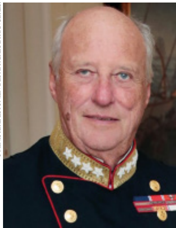
Le roi Harald V.