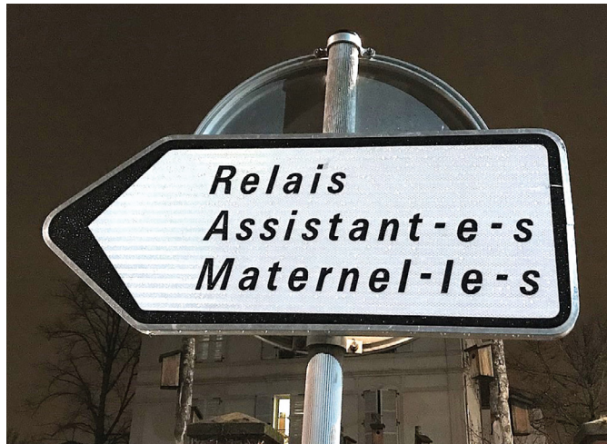
Écriture inclusive. La proposition de loi du Sénat visant à défendre la langue française est encalminée à l'Assemblée.

Son utilisation devient un marqueur sociétal de l'acceptation de cette pensée redressée. Les inégalités sociales liées aux conditions de travail, de rémunération ou de logement ne sont plus ici d'actualité. De même, peu importe que l'écriture faussement inclusive évince les personnes dyslexiques ou souffrant d'autres troubles « dys », les déficients visuels ou les personnes en difficulté