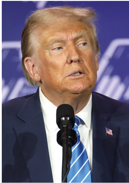
Donald Trump en campagne dans le Nevada. À 78 ans, peut-il commencer une carrière de dictateur ?

L'attention se porte spécialement sur quelques « trous » dans l'armure : 1/ les procureurs (93 procureurs fédéraux indépendants nommés par le ministère de la Justice, lequel, depuis le scandale du Watergate, dispose d'une autonomie de décision par rapport au président, ce que