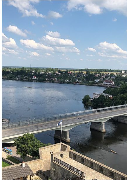
Frontière russo-estonienne à Narva. La défense des pays baltes est un casse-tête pour l'Otan.

Steadfast Defender. – Les grandes manœuvres en cours, les plus importantes depuis 1988, mobilisant 90 000 hommes, entre le 22 janvier et le 31 mai, complètent ce dispositif en étant centrées, pour ce qui concerne sa phase centrale dite Dragon 24 , sur l'acheminement rapide de