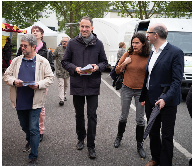
Raphaël Glucksmann en campagne pour les européennes. Il vise un score à deux chiffres.

Certains militants jugent même Marie Toussaint trop faible pour mener la campagne et doutent sérieusement de sa stratégie. Stagnant