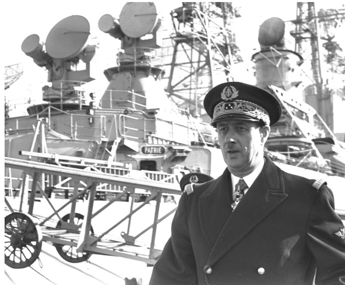
L'amiral Philippe de Gaulle.

À partir de 1944, il commande un peloton du régiment blindé de fusiliers-marins au sein de la 2 e division blindée (2 e DB) et participe à la libération de Paris avant d'achever la guerre en Allemagne. Il reçoit la croix de guerre 1939-1945 des mains du général Lelerc mais ne sera jamais fait compagnon de la Libération bien qu'il fût, selon Geoffroy Chodron de Courcel, aide de camp du général de Gaulle à Londres, le premier compagnon de son père. On sait en effet à quel point le Général ne