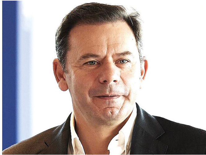
Luis Montenegro. Le chef de la coalition portugaise de centre droit arrive de justesse en première place des législatives.

Les élections législatives portugaises du 10 mars dernier sont le résultat de la démission du Premier ministre António Costa, le 7 novembre 2023, pris dans les rêts d'un scandale de corruption dans lequel sont mis en cause également de nombreux hauts fonctionnaires et membres du gouvernement. Comme il s'y était engagé en cas de démission du chef du gouvernement, le président de la République, Marcelo Rebelo de Sousa, a dissous l'Assemblée alors même qu'il pouvait décider de nommer une nouvelle personnalité politique issue de la majorité socialiste. Son engagement au sein du Parti social-démocrate, principal parti d'opposition, a-t-il motivé son choix ? C'est une affaire entre lui et sa conscience. Cependant, conformément aux vœux du Parti socialiste, les élections se sont tenues le 10 mars afin de permettre à ce parti de faire campagne dans de bonnes conditions, en ayant le temps nécessaire à la promotion de son programme.