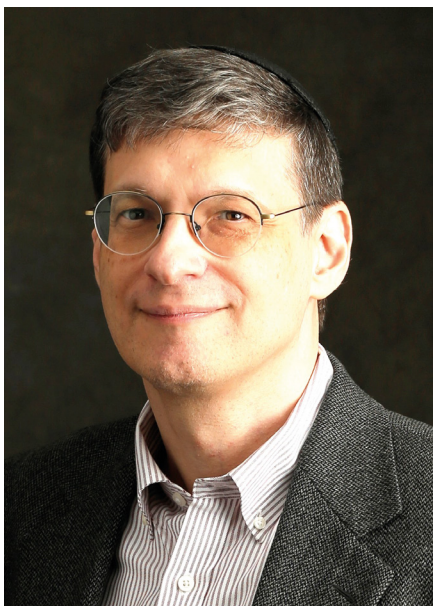
Le philosophe Yoram Hazony. Figure controversée du conservatisme américain.

La première, fondée en 1938, très axée sur les entreprises privées comme son nom l'indique, fut particulièrement influente sous la présidence Bush junior. Elle a