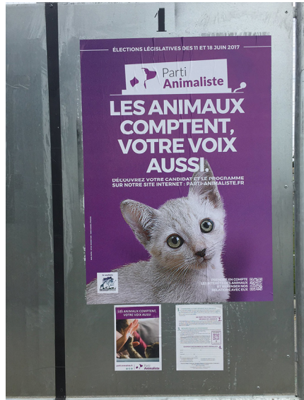
Parti animaliste. Un phénomène de société.

L'opinion publique a, quant à elle, intégré la dimension « sensible » des animaux : l'association L214 a, par ses vidéos, suscité une légitime indignation : broyages de poussins, « claquage » de porcelets, maltraitance dans les abattoirs... L'opinion publique a manifesté une réprobation certaine. Bien avant, nombre d'associations se sont créées et ont déployé leur énergie. La Société protectrice des animaux (SPA) mais aussi la Ligue de protection des oiseaux (LPO). Des personnalités se sont engagées en faveur des animaux, comme Brigitte Bardot, mais aussi d'autres, qui se sont associées aux ONG pour défendre le bien-être animal. Ainsi Michel Sardou s'indignait-il récemment – et à raison – du sort tragique d'un chien, massacré, égorgé, éviscéré en Normandie.