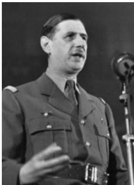
Le général de Gaulle au Royal Albert Hall de Londres, le 11 novembre 1942. Dans un discours magnifique exhortant les Français à l'unité, il conclut son propos par la formule célèbre : « un seul combat pour une seule patrie ».

L'officier mal noté qui s'est fâché avec le maréchal Pétain n'est qu'un simple colonel en mai 1940. Nommé général de brigade à titre temporaire, il ne peut rivaliser avec Weygand, Noguès, Catroux... Devenu secrétaire d'État, il pèse peu face aux grands ténors de la III e République. En juin 1940, Paul Reynaud, Georges Mandel, Léon Blum auraient pu former en Afrique du Nord un gouvernement d'union nationale et continuer la lutte. À Londres, le général rebelle commande une modeste troupe de réfugiés inconnus qui est comme un fétu de paille dans la guerre qui devient mondiale. Churchill est vite excédé par son arrogance et Roosevelt déteste cet apprenti dictateur, que Staline méprise. Tous les Français hostiles à Vichy ne l'ont pas rejoint : les gens bien sont à New York (Jacques Maritain, Alexis Léger qui signe Saint-John Perse...), et l'amiral Muselier, qui commande les Forces navales françaises libres essaie de s'imposer contre lui à Londres. Les États-Unis, qui ne désespèrent pas de Vichy, soutiennent à Alger le général Giraud. Roosevelt voudra ensuite imposer aux territoires français libérés une administration militaire et une monnaie, comme si la France était un pays vaincu. Au sein de la Résistance intérieure, certains chefs