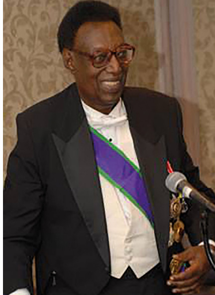
Kigeli V, dernier roi du Rwanda (1936, 2016).